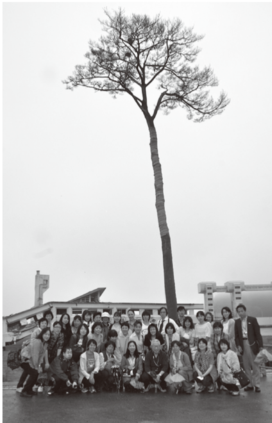
奇蹟の一本松にて

当日は高田町に入る手前の住田町から釜石までの案内役を務めさせて頂きましたが、皆様のお蔭で私自身がタイムマシンに乗れた事にも感謝しています。釜石でオリジナルの鎮魂歌を捧げる事が出来た時、「今ここに」居る事の必然性を確信しました。太平洋の大海原を向き、凜として立つ釜石大観音の後ろ姿が脳裏から離れません。『あなた様の慈悲深い御心で、そのやわらかい後光に犠牲者の魂をそっと包み込み、アメリカの自由の女神様に届けて下さい』と願った時、海にのまれてしまった行方不明の方々に思いを馳せ、遠くの国に流れて行ってしまった瓦礫の魂も救われて欲しいと願っている私が居ました。