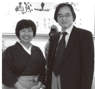
宝来館女将さんと先生